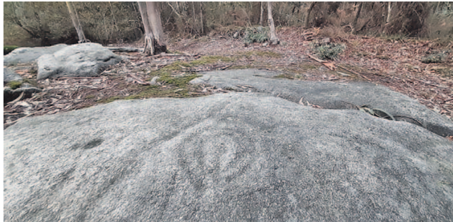
Un dos petróglifos que se poden atopar nas rutas sinalizadas en Vilarmaior.