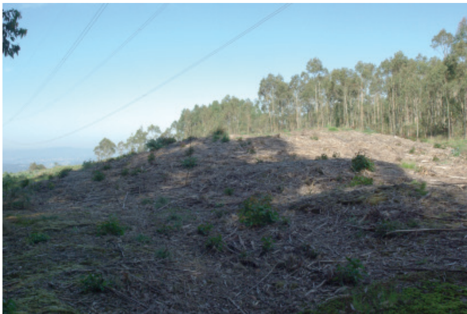
Fotos 2 e 3.- Mámoa do Pozo do Croio-2.