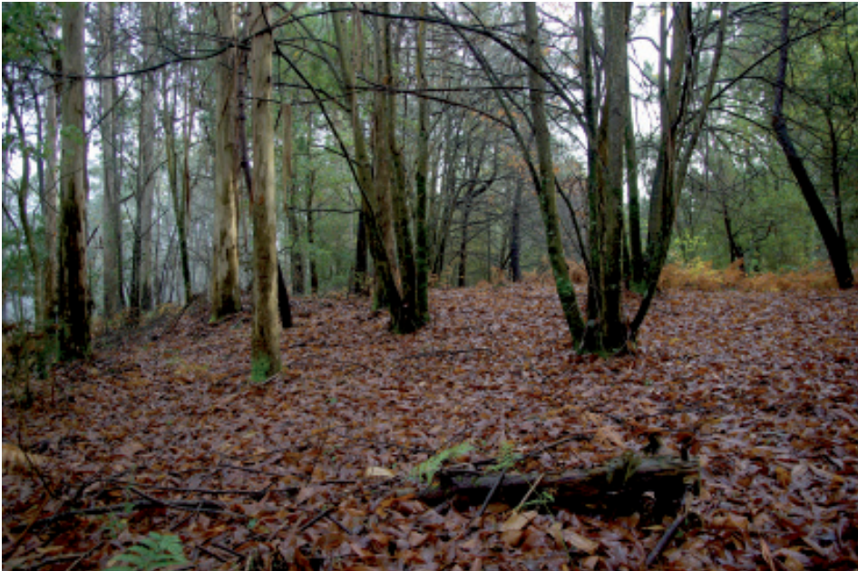
Foto 1.- Mámoa do Rapadoiro.