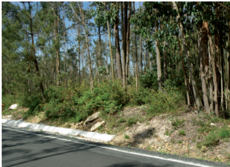
Foto 3.- Mámoa do Monte da Rampla.

6) Porto dos Carros (coordenadas UTM 571769 – 4793924, xeográficas 08° 06'55,09" – 43° 17'38,19"). Emp.: Ladeira. Alt.: 368 m. Reg.: 150 m. Subst.: Granito de dúas micas. Terr.: Arborado de repoboación. Med.: 19 m de Ø x 0,80 de alto. Est.: Bo. Está cortada pola una gabia a valado de pedras de N a S.